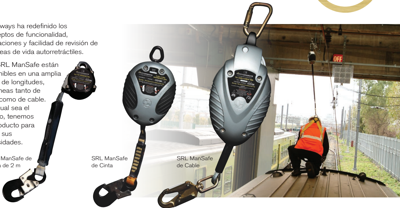
SRL ManSafe de Cinta de 2 m

Las SRL ManSafe están disponibles en una amplia gama de longitudes, con líneas tanto de cinta como de cable. Sea cual sea el trabajo, tenemos un producto para cubrir sus necesidades.